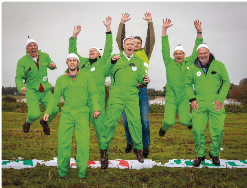
Een groep enthousiaste 'windhelden' van Windpower Nijmegen.