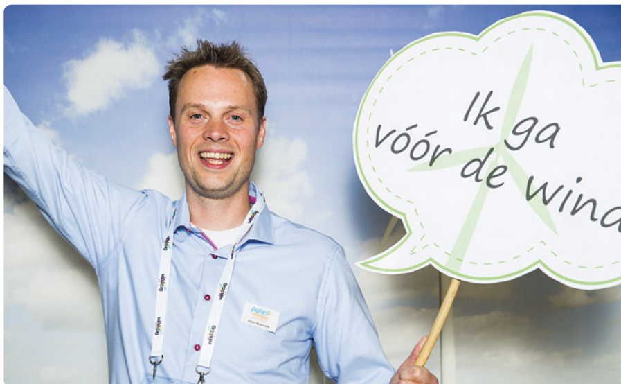
Zet 'windhelden' in het zonnetje!

In het ideale geval gebeurt bovenstaande door gezamenlijk een windvisie op te stellen. Bewoners kunnen dan meebeslissen over de locatie en de grootte van het park. Als je samen op zoek gaat naar locaties, kun je als gemeente uitleggen welke locaties wel en niet geschikt zijn: bijvoorbeeld vanwege natuurbescherming, de wettelijk geregelde afstand tot wegen en de afstand die je moet houden van leidingen onder de grond. Wanneer je dit deelt met burgers en samen naar de overgebleven mogelijkheden kijkt, creëer je begrip voor de mogelijke locaties en heb je een goed antwoord op de vraag die vaak gesteld wordt bij windprojecten: waarom hier?