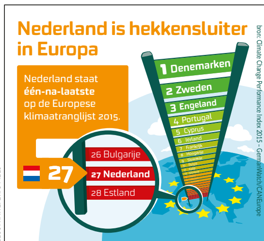
ILLUSTRATIE: ERIC MELS

Wij hebben de ervaring dat windprojecten waarin burgers participeren makkelijker van de grond komen. Burgers kunnen dus een significante rol spelen in de energietransitie. Duitsland geeft hierin een geweldig voorbeeld. Daar is bijna de helft van alle duurzame energieprojecten in handen van burgers.