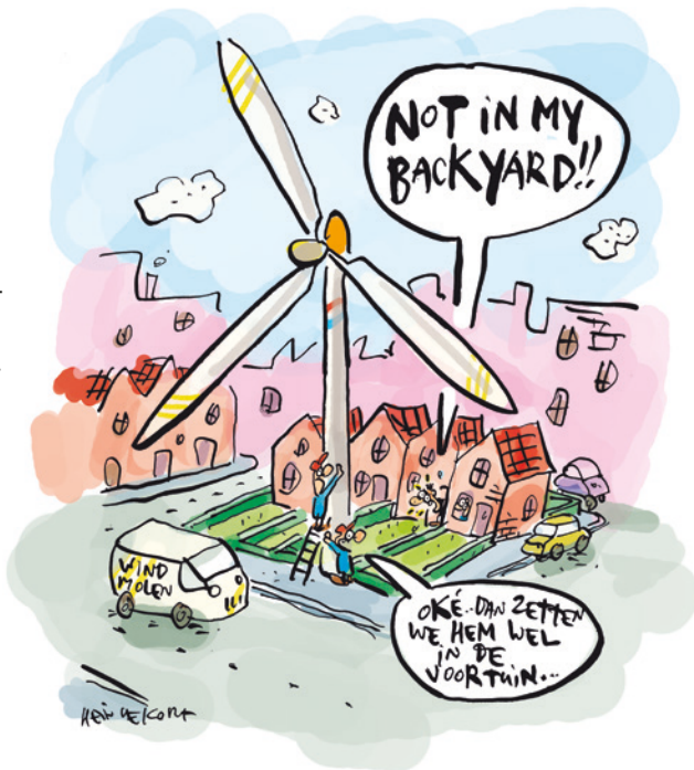
CARTOON: HEIN DE KORT/COMICHOUSE.NL